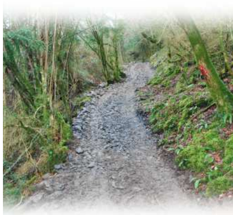
... état après que M. Gaspé soit passé

Dès la fin des travaux, des dispositions seront prises pour interdire tout accès aux véhicules motorisés (un arrêté municipal sera pris et des dispositifs seront installés). L'objectif recherché étant avant tout et exclusivement de faciliter l'usage pastoral.