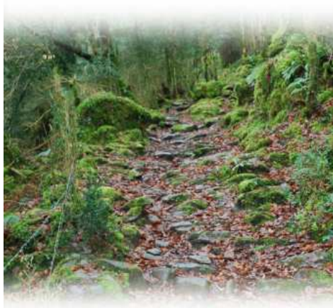
Etat initial du Cami Bieilh...

Véritable élément du patrimoine historique de Louvie-Juzon, le Cami Bieilh est l'un des plus vieux chemins de transhumance de la Commune. Par là, des générations et des générations de bergers et d'éleveurs se sont succédées au fil des siècles pour amener les troupeaux aux estives.