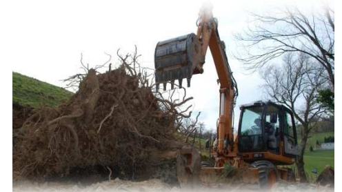
Les grands moyens souvent nécessaires