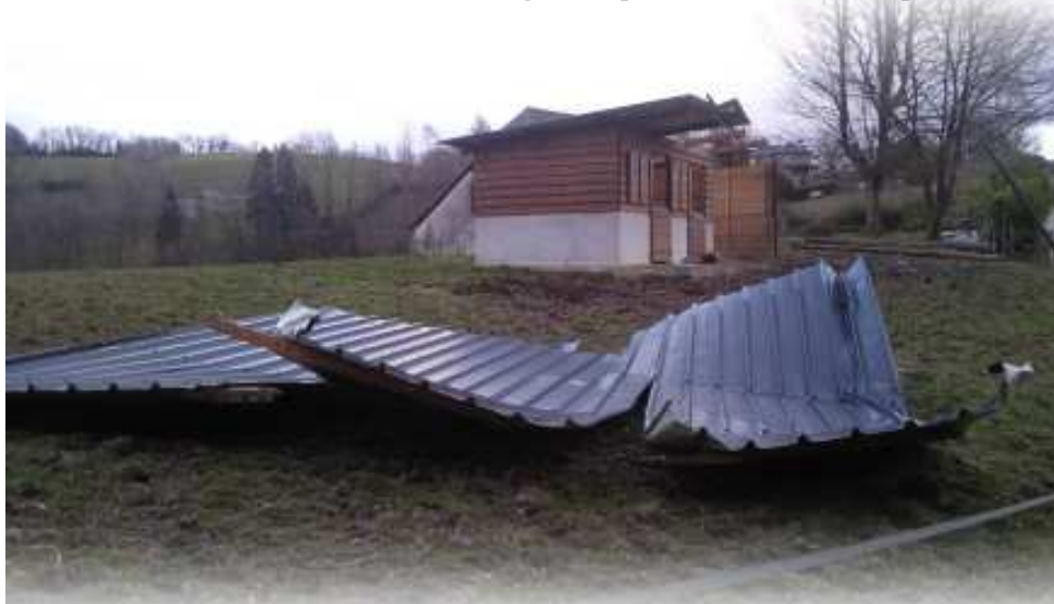
Plus d'abri pour les juments du Cot de las Bouts

Samedi 27 février en fin d'après-midi, à l'heure où l'Angleterre tentait de sauver les meubles face à l'Irlande, le vent commençait à se lever sur la France... Déjà, les premières coupures d'électricité privaient certains de la fin du match.