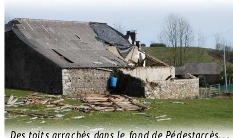
Des toits arrachés dans le fond de Pédastarrès...

Seconde priorité : rétablir les lignes électriques au plus vite. En effet, très nombreux étaient les foyers privés