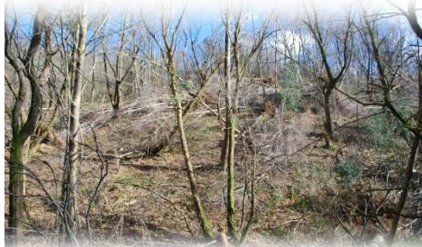
La forêt de Bourdiala meurtrie et dévastée

les lieux mêmes des sinistres. Pour cela, nombreux étaient ceux à se proposer : voisins, habitants du bourg, chasseurs et autres bonnes volontés se manifestaient spontanément. Rapidement, des équipes s'organisaient et une solidarité exemplaire s'installait