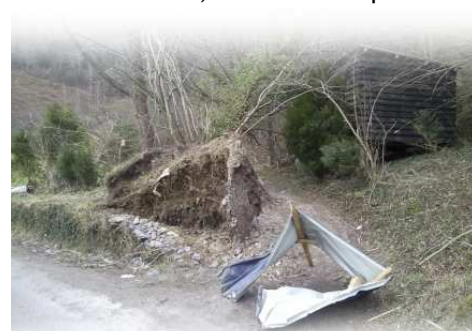
Des tôles envoyées à plusieurs centaines de mètres

la ligne électrique, par les courts-circuits et ravageait les bois et les granges qui se trouvaient sur son passage. « On voyait des boules de feu qui partaient et qui allumaient de nouveaux foyers quelques dizaines de mètres plus loin ». Les pompiers inter-