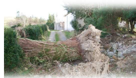
Des chemins obstrués par des arbres centenaires

viendraient rapidement pour maîtriser les flammes dévastatrices.