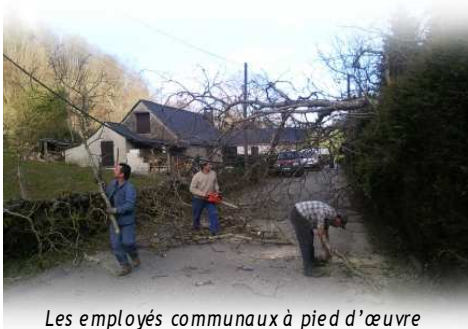
Les employés communaux à pied d'œuvre

saient rapidement comme les secteurs de la Commune les plus touchés. Bien heureusement, les dégâts constatés n'étaient que matériels : toits de maisons endommagés, granges et hangars éventrés, murs effondrés, lignes électriques et téléphoniques coupées, arbres déracinés, routes et chemins bar-