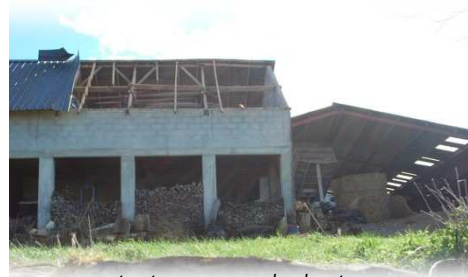
... tout comme sur les hauteurs

d'électricité. Les machines et les congélateurs ne tournaient plus, posant nombre de problèmes aux uns et aux autres. Qu'il s'agisse des lignes moyenne tension de 20 000 V qui alimentent les transformateurs ou des