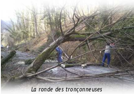
La ronde des tronçonneuses

rés, ruisseaux obstrués et trois vaches mortes, écrasées par l'effondrement d'un mur. Tel était le bilan global. Première priorité : le dégagement des axes d'accès pour permettre l'arrivée des différents services de secours sur