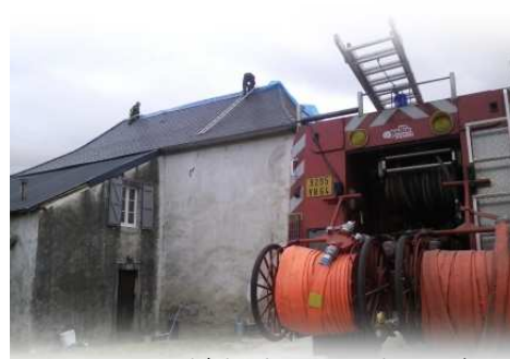
Une urgence : bâcher les toits endommagés

lignes basse tension qui desservent les particuliers, toutes étaient endommagées. Pour réparer tout ça, seuls les services d'EDF étaient compétents. Ceux-ci arrivaient assez vite sur place et déployaient tout leur savoir faire pour parer à l'urgence. On peut néanmoins regretter que le PC de crise et l'organisation d'EDF, injoignables en de tels instants , ne puissent assurer une coordination satisfaisante des différentes interventions. Pour autant, il faut saluer le sérieux, la compétence et le dévouement des agents présents sur place qui n'ont pas hésité à travailler tard dans la nuit pour raccorder au réseau le plus grand nombre et le plus rapidement possible.