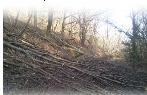
Le chemin de Boudiala encombré

et dangereux de rester dehors. Quelques ardoises s'arrachaient et s'envolaient, les premières branches ne tar-