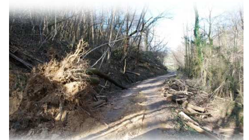
Passage rétabli au Chemin du Bourdiala

Enfin et malgré les critiques toujours faciles en de telles situations, la plupart des foyers étaient au sec et à nouveau alimentés en électricité 48 heures après le passage de Xynthia. Deux maisons seulement ne retrouvaient un fonctionnement à peu près normal que le mercredi. En ce qui concerne la remise en état des lignes téléphoniques, les choses s'avèrent également très difficiles. Là encore, l'éclatement des services nuit considérablement à la rapidité et à la coordination des interventions.