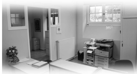
Un accueil spacieux et convivial...

Tout en optimisant les conditions de travail, cette nouvelle organisation vise à améliorer la qualité de l'ac-