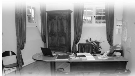
Un bureau du Maire digne et chaleureux...

En ce qui concerne les autres pièces, la réflexion se poursuit. Les sanitaires devraient notamment être re-