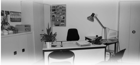
Un secrétariat sérieux et indépendant...

L'utilisation des volumes de la Mairie était insatisfaisante. En effet, les secrétaires devaient travailler dans un seul et même bureau alors que la pièce du fond restait le plus souvent inutilisée. Pour remédier à ce constat, les bureaux ont été réaménagés. Une porte a ainsi été percée entre