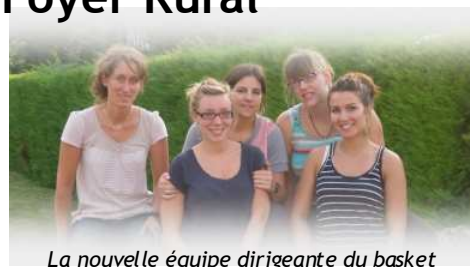
La nouvelle équipe dirigeante du basket